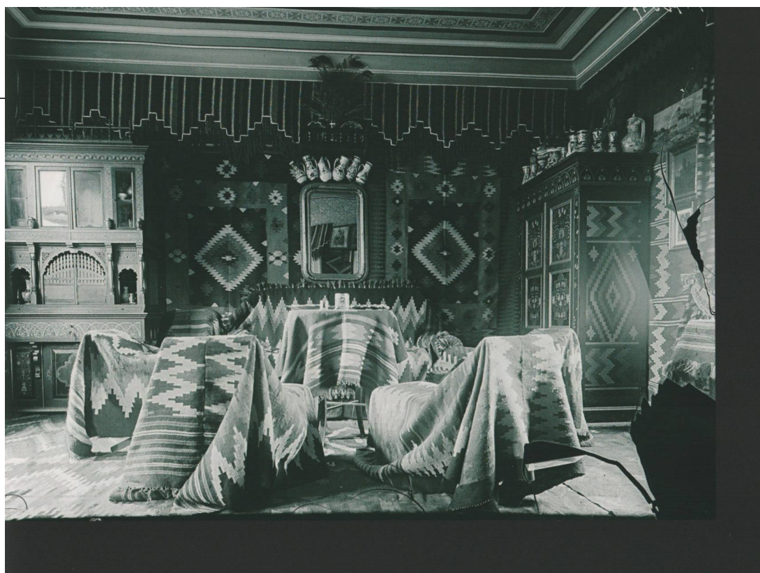
366 Huszka József lakása Sepsiszentgyörgy, 1880-as évek vége Üvegnegatív, 18x24 cm F 70597