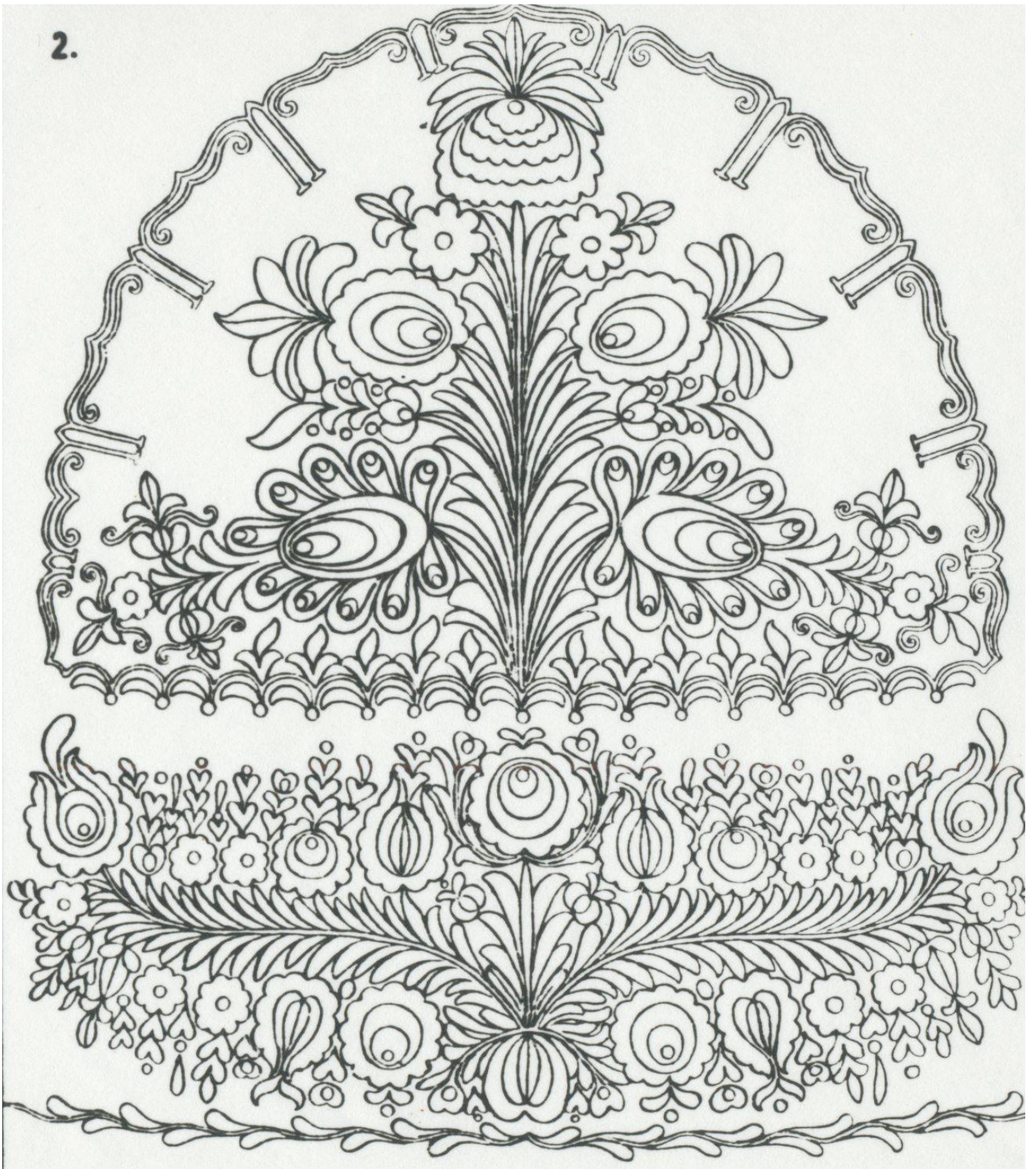
Suba tányér Deskó József szüicsmester rajza